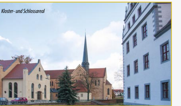
Kloster- und Schlossareal