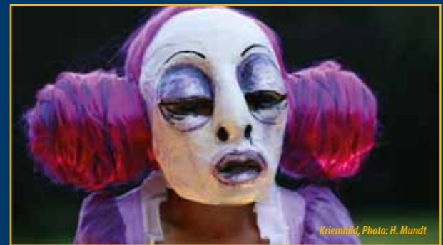
Kriemhild