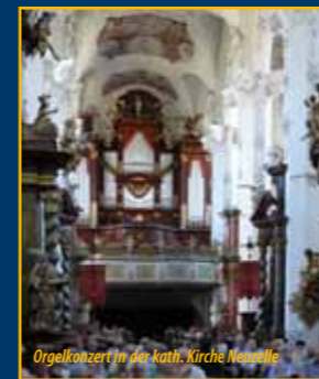
Orgelkonzert in der kath. Kirche Neuzelle