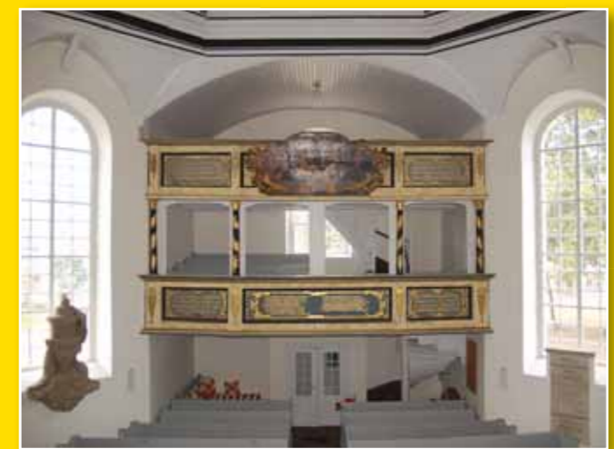
Kreuzkirche in Neustadt (Dosse), erste barocke Zentralkirche in der Mark Brandenburg