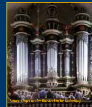
Sauer-Orgel in der Klosterkirche Doberlug

Informationen, Kartenservice, Gesamtprogrammheft und Anmeldungen Arbeitsgemeinschaft Orgellandschaft Niederlausitz c/o Rudolf Bönsch Dammstraße 28 03222 Lübbenau T/F: 03542-3289 (AB) www.orgelklang.de