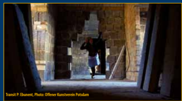
Transit P: Ebunent