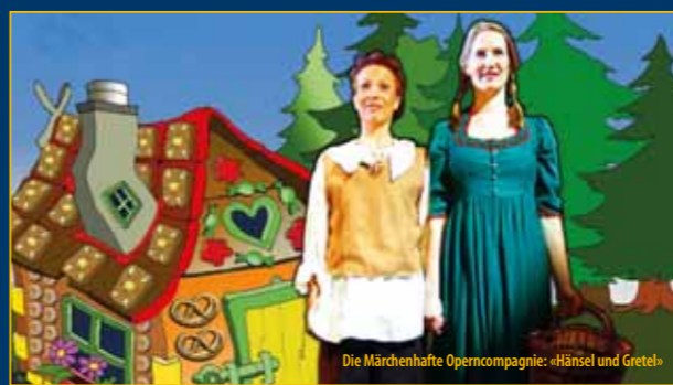
Die Märchenhafte Operncompagnie: «Hänsel und Gretel»

Freitag, 6. August Samstag, 7. August Multikulturelles Zentrum Templin, Prenzlauer Allee 6 Wasserspiele Templin Konzerte, Theater, Kleinkunst, Akrobatik